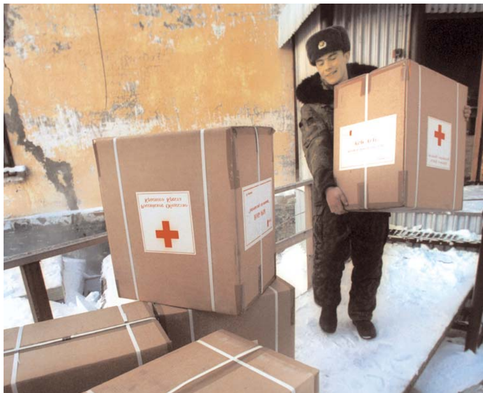
La función de auxiliares de los poderes públicos que cumplen las Sociedades Nacionales ha evolucionado respecto al concepto original de prestación de servicios médicos en conflictos armados.

En el estudio se asevera que en el plano nacional, las Sociedades Nacionales ocupan una posición singular, respecto a la de cualquier otra organización humanitaria, pues se caracteriza por un estatuto jurídico concreto que se rige por una serie de instrumentos jurídicos tanto de ámbito nacional como internacional. Esto último facilita su relación con los Estados, una relación que debe nutrirse del respeto y la aceptación de críticas cuando se entabla el diálogo sobre cuestiones humanitarias que son espinosas.