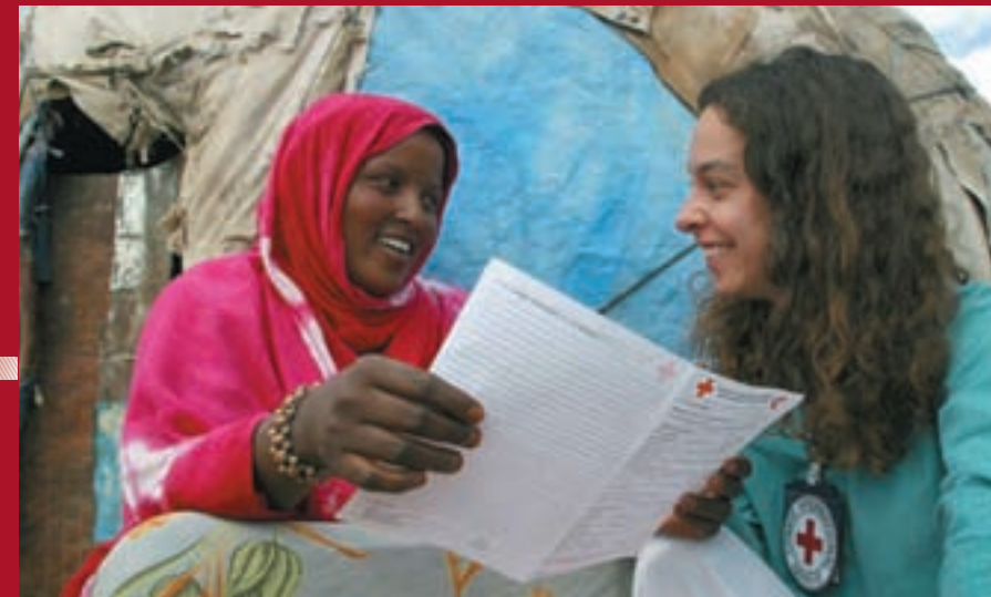
מתנה פלטים בבייבטי 2003, חלוקה ואיסוף של הודעות צלב אדום