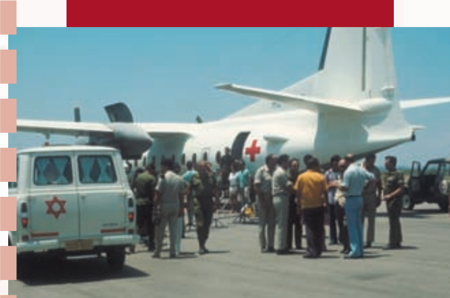
שדה התעופה לוד 1974. החזרת שבויי מלחמה ישראלים מסוריה.