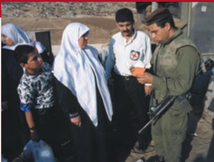
1997, ביקור משפחות

פעולות הסברה בנושאים אלה מתקיימות בצד הישראלי ובצד הפלסטיני לאוכלוסיות שונות, בראש ובראשונה לזרועות הביטחון ולנוטלים חלק בלחימה, אך גם לצוותים רפואיים, לסטודנטים, למשפטנים ועוד. במסגרת זו, פיתח הארגון ערכת חינוך להכרת המשפט ההומניטרי הבינלאומי עבור תלמידי תיכון, בשיתוף פעולה הדוק עם משרדי החינוך הישראלי והפלסטיני, המיישמים אותה בימים אלה.