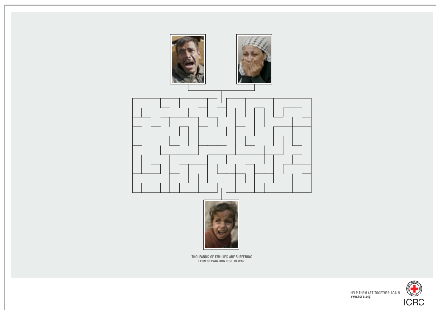
Publicité de l'agence BBDO Argentina, qui a remporté le Lion de bronze au Festival international de la publicité à Cannes