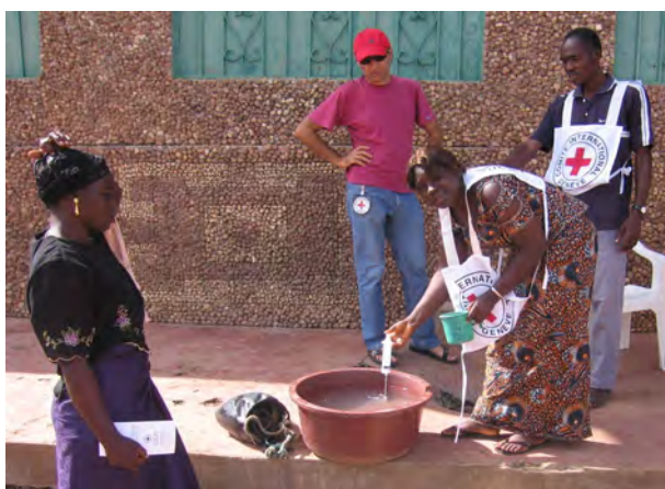
Séance de chloration de l'eau à Bouaké.