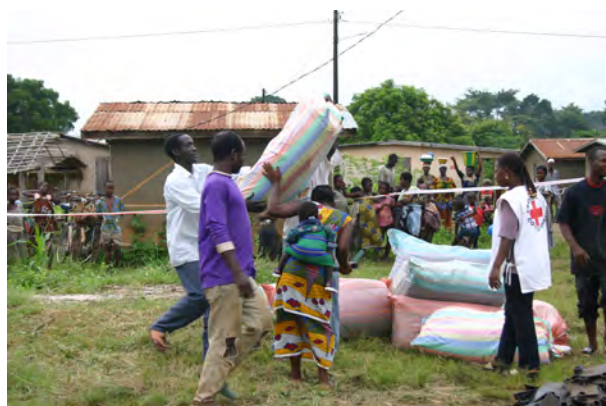
Distribution de semences à Duekoué.