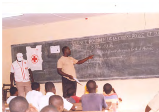
Atelier de diffusion aux volontaires à Aboisso.