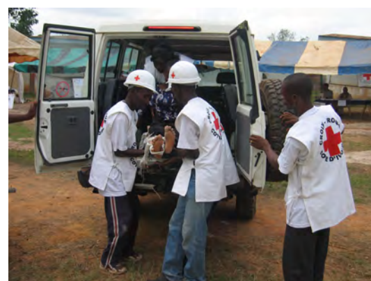
Séance de simulation des secouristes à Gagnoa.