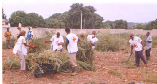
Activité d'assainissement à Korhogo.