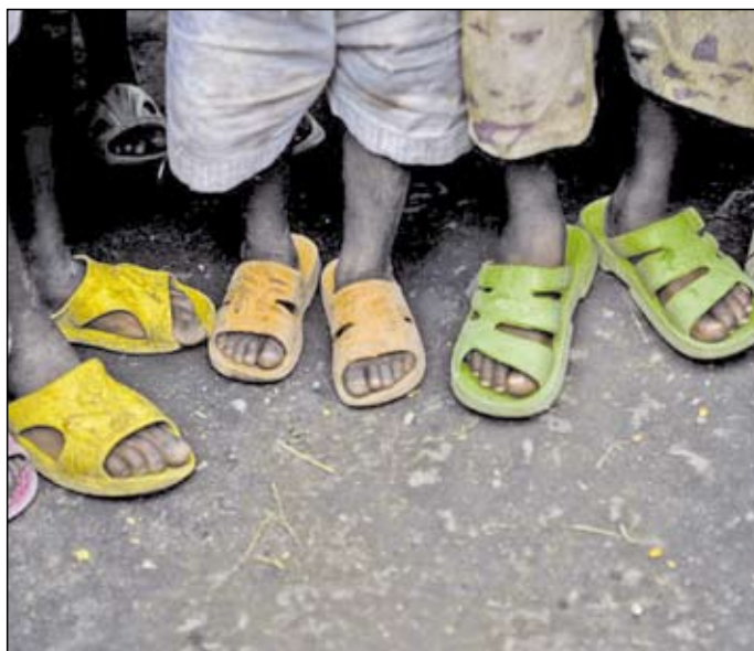
Goma. Enfants séparés de leurs parents par le conflit.

Aux yeux de Bahati, les choses vont bien. « Bien sûr, les petits pleurent parfois le soir, lorsqu'il faut aller se coucher, et je dois les consoler. Mais en général, ils sont calmes, car ici ils reçoivent de la nourriture. »