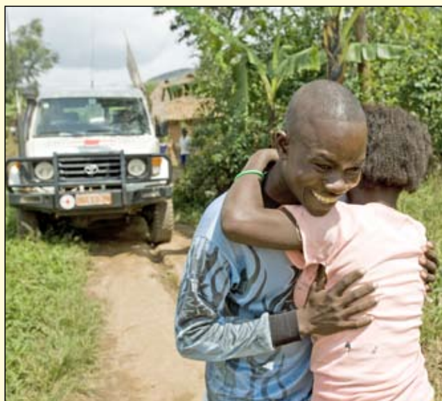
Banga, 17 ans, retrouve sa famille, qu'il avait perdue durant les combats, grâce au programme de regroupement familial du CICR.