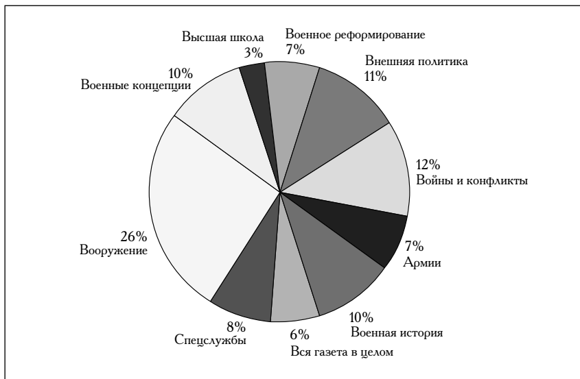
Диаграмма 1. Рубрики военного еженедельника, вызывающие наибольший интерес у читателей (источник: интернет-опрос на сайте «НВО», январь 2002 г.)