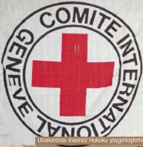
Uluslararası İnsancıl Hukuku yaygınlaştırmak