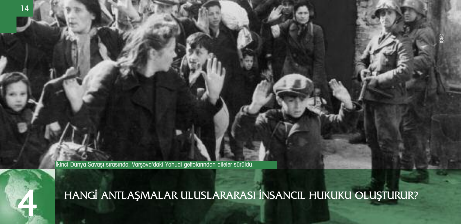
İkinci Dünya Savaşı sırasında, Varşova'daki Yahudi gettolarından aileler sürüldü.