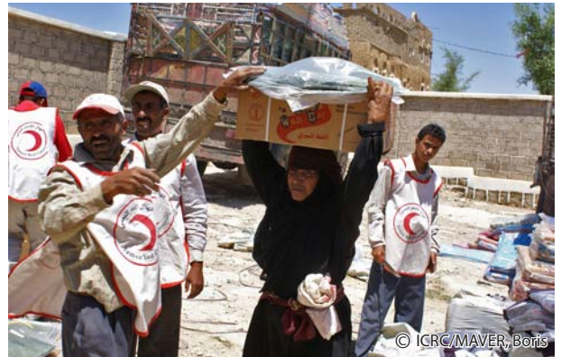
ICRCと現地の赤新月社が連携し、イエメンの国内避難民に緊急物資を提供（2009年9月）

について、もっと関心を払う必要があります。私たちは今後も、国内避難民の発生を防ぎ、家を去ることを余儀なくされた人々を一層保護するために、国際人道法の更なる尊重を呼びかけます」