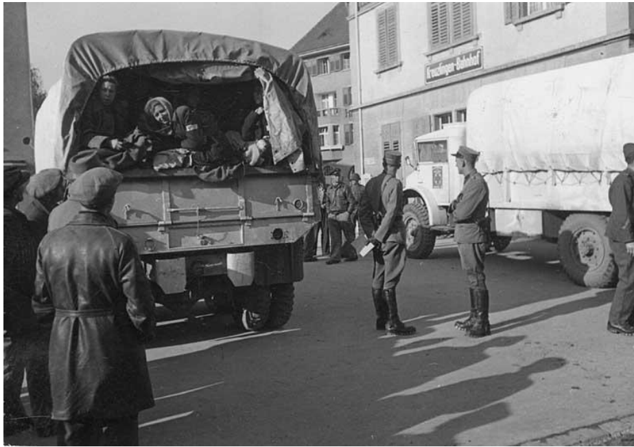
Kreuzlingen. ex-détenues du camp de concentration de Ravensbrück évacuées par le CICR, CID

Suite à la fermeture des communications routières entre le Sud et le Nord de l'Allemagne, qui rend impossible l'organisation d'un nouveau convoi vers Ravensbrück, le cœur de l'intervention du CICR se déplace alors vers le Sud du pays. Le Comité international réalise trois transports de déportés depuis Mauthausen (les colonnes 35, 36 et 37) 76 , qui permettent le transport de 780 déportés de nationalité française, belge et hollandaise, entre les 23 et 24 avril 77 . Quelques jours plus tard, deux nouveaux convois assurent l'évacuation successive de 183 et 349 déportés de Mauthausen et de 200 Suisses depuis Landsberg 78 . Mis à part ces transports (1512 personnes), il faut noter la participation du CICR au rapatriement de 2250 civils français d'Italie du Nord à la fin avril 79 et, début mai, au transfert par deux bateaux affrétés par le CICR de 806 ex-détenus depuis le port de Lübeck vers la Suède 80 . Après la fin