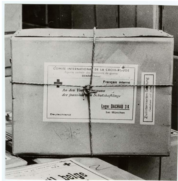
Colis CICR à l'intention de déportés français au camp de concentration de Dachau, CID