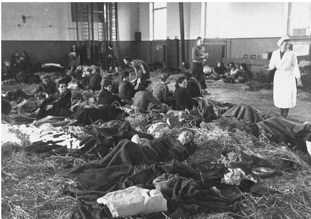
Kreuzlingen. ex-détenues du camp de concentration de Ravensbrück regroupées dans une salle de gymnastique après leur évacuation par le CICR, CID

La colonne 36 dont il assume la responsabilité est notamment bloquée à la frontière de 17h jusqu'à 10h le lendemain matin par les autorités douanières suisses. Les ex-détenus sont contraints à passer la nuit sur la route, sans couvertures, boissons chaudes, ni vivres. En outre, Rubli pointe l'absence de structures d'accueil sanitaires, d'abris et le transfert des évacués dans des wagons de troisième classe 106 . De manière plus générale, le CICR, mis à part le travail du délégué Hort, qui à son initiative réalise des premiers soins médicaux pour 500 détenus à Landsberg 107 , ne réalise qu'une contribution modeste aux différentes missions sanitaires engagées pour le sauvetage des déportés libérés. Par exemple, Jean Rodhain, aumônier général des prisonniers de guerre et des déportés en France, organise trois missions sanitaires vers Bergen-Belsen, Dachau, Mauthausen et Buchenwald 108 . La Croix-Rouge britannique mobilise à Bergen-Belsen cinq équipes renforcées par des Quakers anglais 109 . Pour sa part, le CICR mandate une mission formée par six médecins et douze infirmières, qui