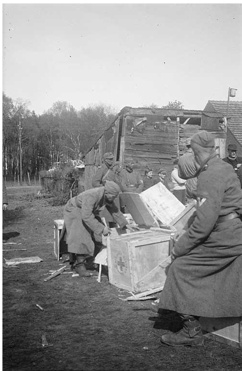
Marche de la mort de Sachsenhausen vers Wittstock. Caisses de colis Croix-Rouge ouvertes par des gardiens allemands