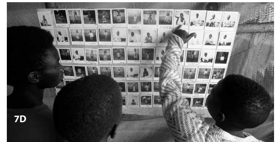
1D Nella sede dell'Agenzia centrale delle ricerche del CICR, Site B camp, Thailandia, 1988. 2D Incontro presso la delegazione del CICR, Baghdad, Iraq, 1991. 3D Una figlia ritrovata, una madre abbraccia la donna che si è presa cura delle sua bambina, frontiera tra il Rwanda e lo Zaire, 1994. 4D Moduli per la ricerca, schede di registrazione e messaggi della Croce Rossa, conflitto arabo-israeliano, 1973. 5D Trasferimento dei detenuti, Libano del Sud, 1998. 6D Una donna ascolta un messaggio della Croce Rossa letto ad alta voce, Bosnia Erzegovina, 1994. 7D Programma CICR per la riunificazione delle famiglie, Rwanda, 1997.