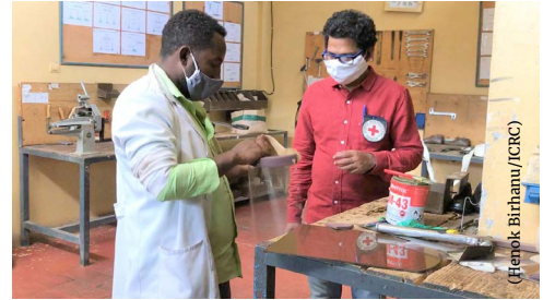
Hojjetaan KQDIA, yeroo deggersa oomisha haguuggii fuulaa, giddu-gala tajaajila qaama miidhamtootaa Baahir Daar, naannoo Amaaraatti godhu, 2020.