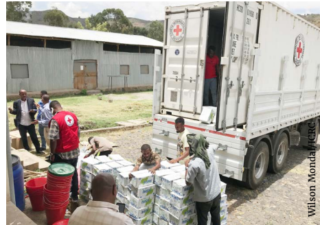
Meeshaalee qulqullinaa mana amala sirreessaa Gondar, naannoo Amaaraaf kenne, 2020