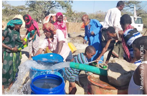
Jiraattota araddaa Awjaabir, aanaa Baabbillee, naannoo Somaalee, sababa walitti bu'iinsaaf miidhaman yeroo bishaan warabbatan, dhibee Koronaa/"COVID-19" dura, 2020.