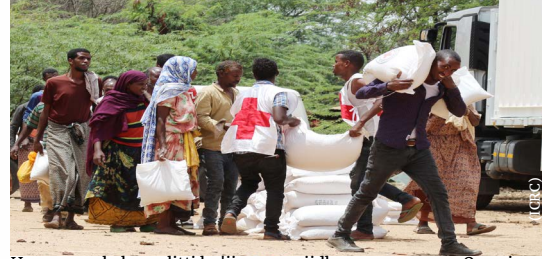
Hawaasa sababa walitti bu'iinsa miidhaman, naannoo Oromiyaa, aanaa Baabillee, araddaa Erer Ibaadaa yeroo sanyii minaanii fudhatan, 2020.