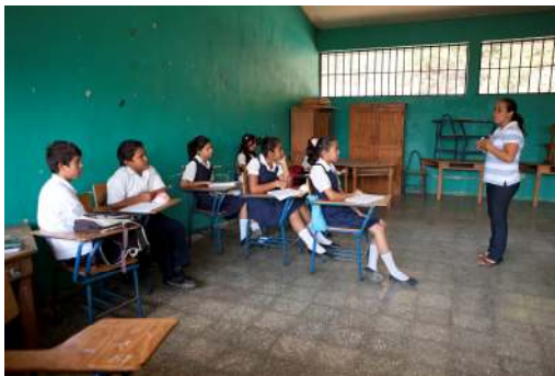
Los alumnos hondureños también tienen un papel importante en la revisión del material didáctico del proyecto AEH.

La escuela de Altos de San Francisco se encuentra en la ladera de una colina empinada. Es un edificio alargado, rodeado de un muro alto que lo separa de las casas sencillas del barrio, y que lo protege un poco de la violencia del entorno.