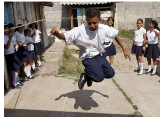
Durante el descanso, los niños se olvidan por un momento de la difícil situación que padecen las escuelas, ríen, juegan y se divierten.