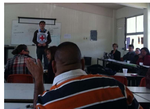
Los maestros de Ciudad Juárez comparten su experiencia sobre cómo afecta la violencia organizada sus comunidades.