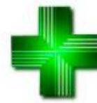
5. Farmacia cruz verde sobre fondo blanco