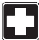
1. Señal de primeros auxilios cruz blanca sobre fondo verde

Cuando se sugiera el uso de signos alternativos, se pueden poner los siguientes ejemplos: