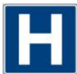
3. Hospital letra "H" blanca en mayúsculas sobre fondo azul