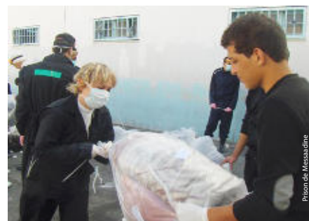
Prison de Messaadine : Déléguée CICR participe au traitement des couvertures et vêtements à l'Ascapoudre.

Une nouvelle campagne qui concernera, cette fois, toute la prison, est prévue mi-2014.