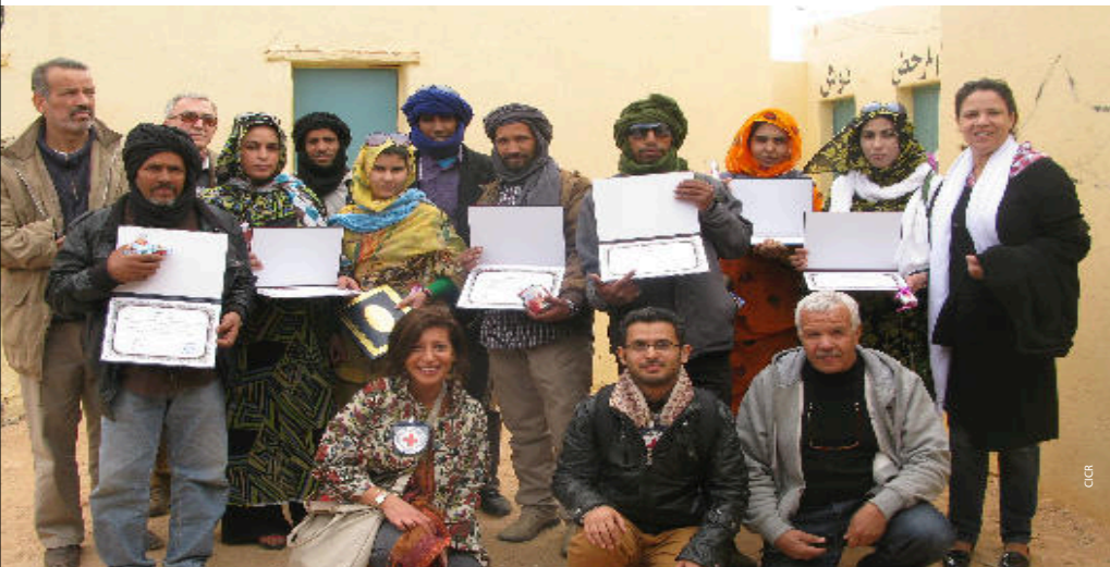
Le CICR remet un certificat de reconnaissance aux collaborateurs du centre de réadaptation physique à Rabouni

Le CICR s'est associé aux populations sahraouies dans le cadre de la célébration de la journée mondiale des personnes à besoins spécifiques qui s'est déroulée les 2 et 3 décembre 2013 dans le camp de réfugiés de Boujdour.