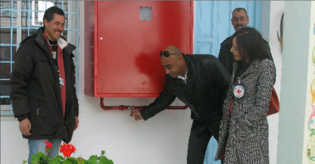
Prison de Sers : vérification du système de lutte contre l'incendie