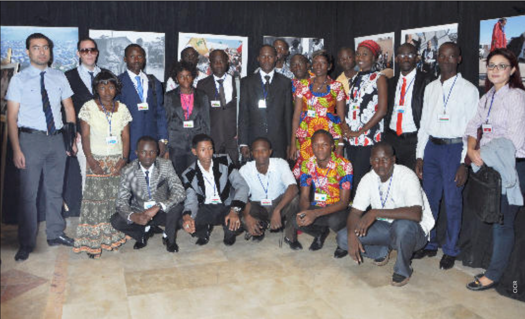
Participants au concours régional de plaidoirie en DIH - Tunis 2013