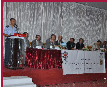
1ère journée d'étude sur l'amélioration des conditions de traitement des personnes durant la garde à vue

Le CICR soutient intensivement ce projet des autorités tunisiennes en offrant un cadre méthodologique de travail afin de faciliter la réflexion et le contact avec de futurs partenaires techniques et financiers.