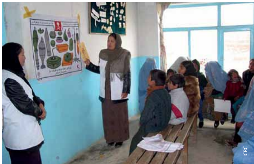
Женщинам и детям разъясняют опасность мин.

Афганский КП должен устанавливать и поддерживать регулярные контакты с представителями правительства на местном, региональном и национальном уровнях, а также одновременно укреплять свою независимость. В афганском Национальном плане действий на случай чрезвычайной ситуации предусмотрено, что Афганский КП входит в состав национальных и провинциальных комиссий по действиям в чрезвычайных ситуациях, и в нем четко прописаны его обязанности и ответственность. Вообще говоря, факт участия Красного Полумесяца в этом координационном механизме является веским аргументом в его пользу, увеличивающим его возможности выполнять свои обязательства. Тем не менее это участие также не обходится без проблем. Например, комиссии возглавляют губернаторы провинций, а в их состав входят представители многих других гуманитарных организаций, в том числе в некоторых регионах представители агентств ООН, а ООН не все заинтересованные стороны рассматривают как нейтральную и беспристрастную организацию в афганском контексте. Персонал Афган-