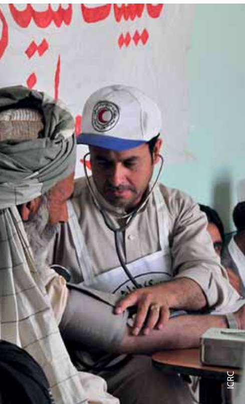
Во время командировки в провинцию Саманган Афганский КП развернул передвижной медицинский пункт для оказания услуг общине.

Руководители отделений поддерживают регулярные контакты со своими добровольцами в общинах, с тем чтобы оценить такие связанные с местными условиями детали, как информацию об активности конфликта и/или о характере насилия, о вооруженных группах, присутствующих в регионе, об имеющихся рисках и потребностях общин. Собранную таким образом информацию вводят в процесс оценки, проводимой Афганским КП, используют для разработки подходящих стратегий реагирования, а затем направляют для более широкого анализа ситуации, проводимого Движением.