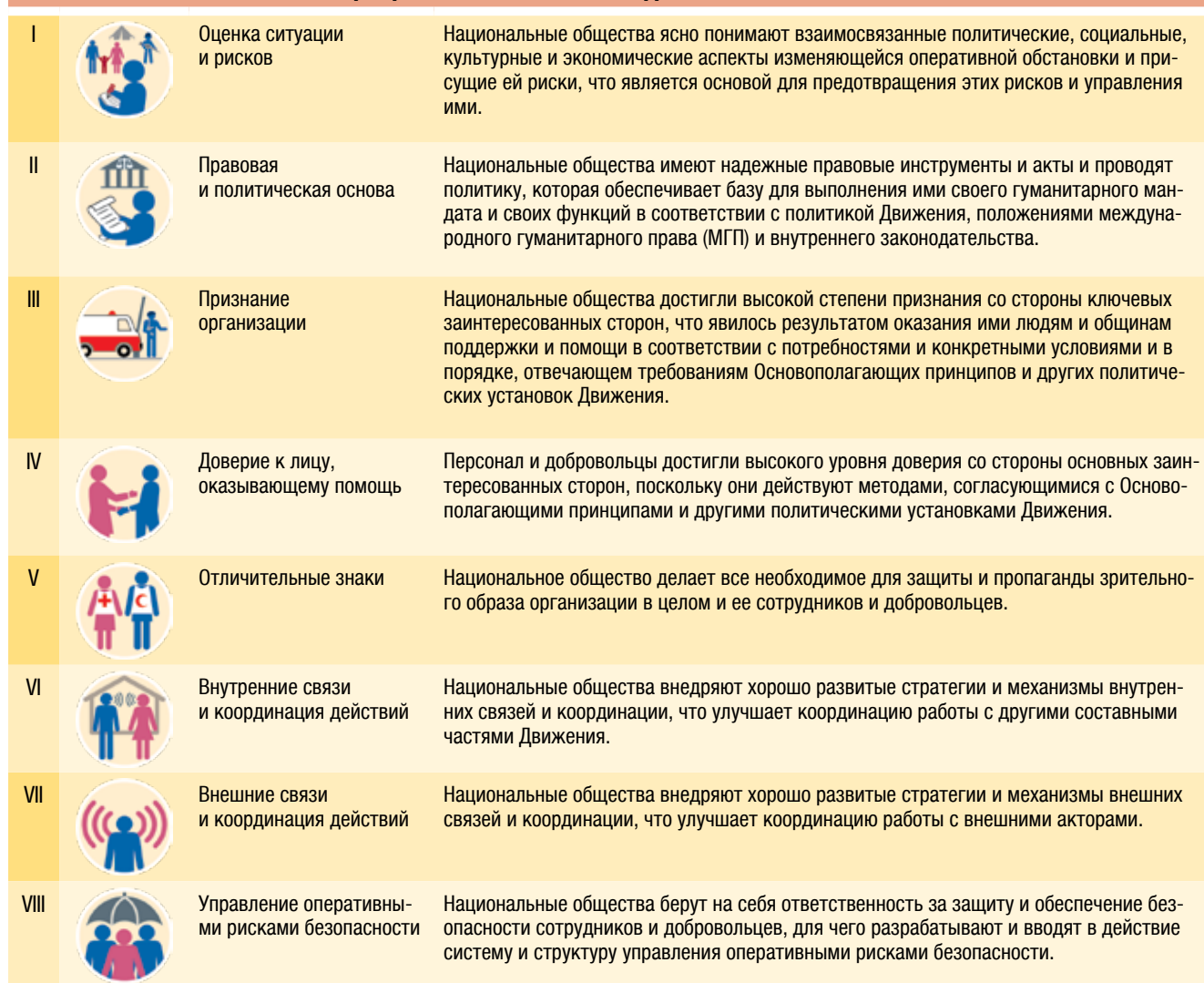
Рис. 2: ВОСЕМЬ ЭЛЕМЕНТОВ КОНЦЕПЦИИ БОЛЕЕ БЕЗОПАСНОГО ДОСТУПА