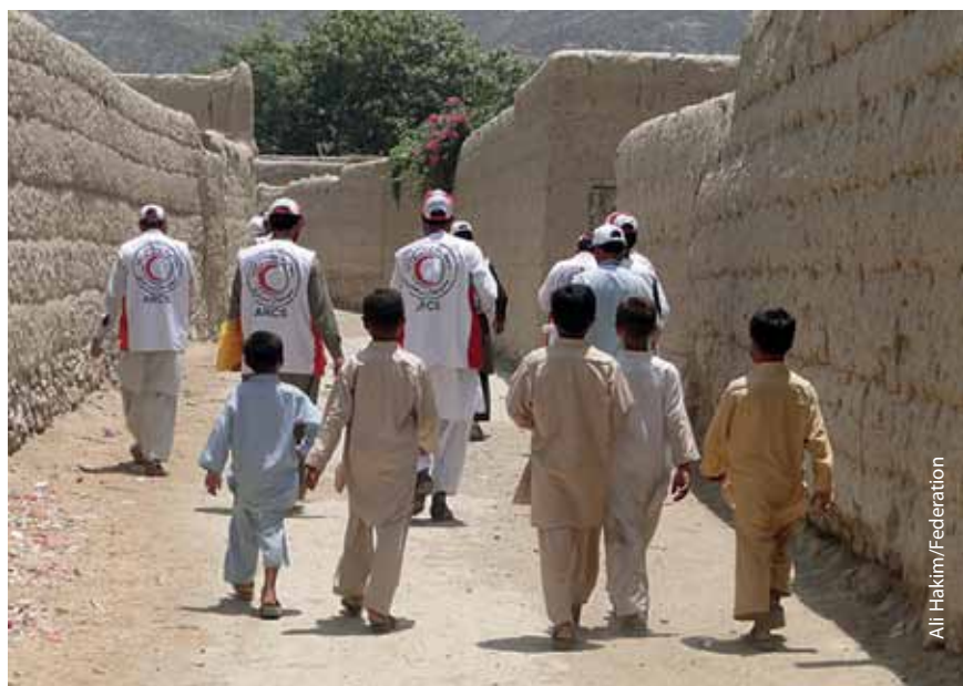
Бригада Афганского КП посетила деревню Хазар Тав, чтобы оценить потребности в помощи.

Стратегия готовности и реагирования на случай конфликта, принятая Афганским Красным Полумесяцем, была определена в качестве необходимого средства увеличить возможности безопасного доступа Движения к как можно большему количеству пострадавших от конфликта людей. МККК, Международная Федерация обществ Красного Креста и Красного Полумесяца, а также партнеры национального общества опираются на широкую сеть добровольцев Афганского КП, которые активно действуют во всех провинциях. Политика Афганского КП по увеличению возможности безопасного доступа к людям и общинам постепенно менялась с течением времени, сообразно с ситуацией и в зависимости от препятствий, которые приходилось преодолевать добровольцам и сотрудникам. Афганский КП