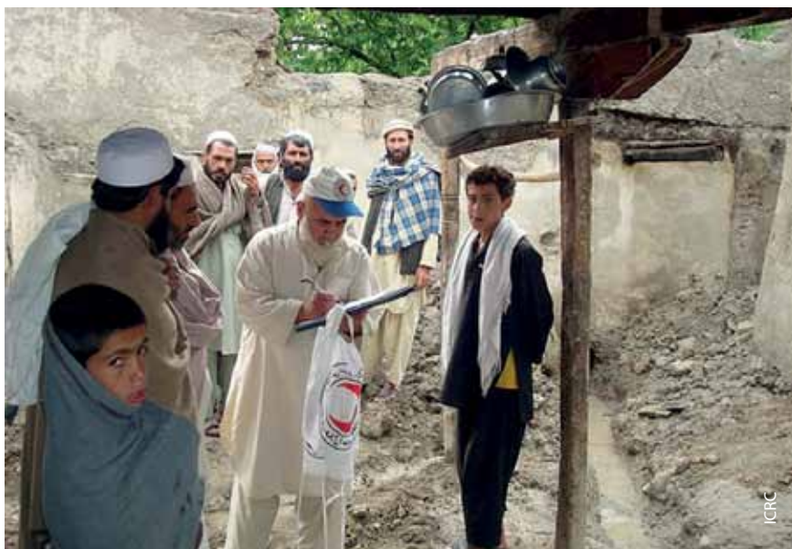
Афганский КП изучает ситуацию в Ширазе.