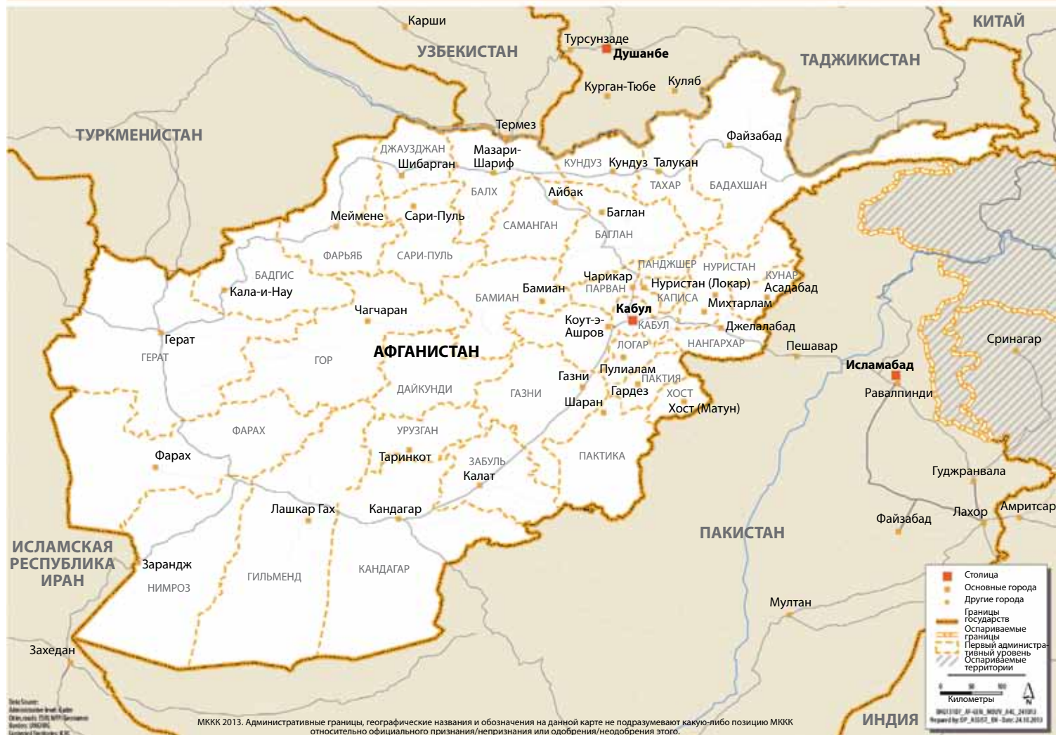
Рис. 1: КАРТА АФГАНИСТАНА