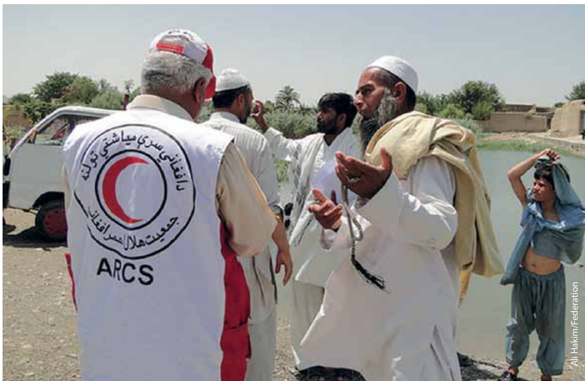
Сотрудники Афганского КП беседуют с членами общины.

Будучи лишь одной из немногих гуманитарных организаций, способных попасть в некоторые районы страны, Афганский КП сталкивается с большими трудностями. Время от времени у него не оказывается достаточно количества местных сотрудников для удовлетворения потребностей общин в отдельных регионах. Учитывая реальные условия, в числе которых наличие разнообразных этнических групп, добровольцам, не являющимся членами той или иной общины, не всегда разрешают оказывать ей помощь.