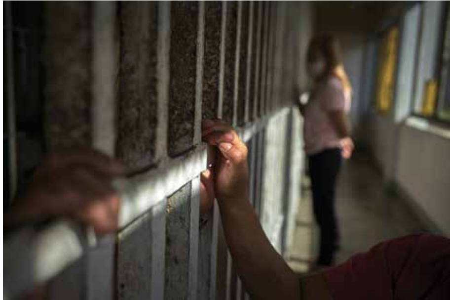
အကျဉ်းသားများအား ၎င်း၏ မိသားစုများနှင့် စာပေးစာယူလုပ်နိုင်ရန် နှင့် မိသားစုထောင်ဝင်စာတွေ့ဆုံနိုင်ရန် ခွင့်ပြုပေးရမည်။

ဂျီနီဗာသဘောတူညီချက်များနှင့် ၎င်း၏နောက်ဆက်တွဲသဘောတူညီချက်များက အပ်နှင်းထားသည့် ICRC ၏ ထူးခြားသည့် လုပ်ငန်းတာဝန်သည် အခြားသူများသွားရောက်နိုင်ခြင်းမရှိသည့် အကျဉ်းသားများနှင့် စစ်သုံးပန်းများအား ထိန်းသိမ်းထားရှိရာ နေရာများသို့ သွားရောက်နိုင်ရန် ခွင့်ပြုပေးပါသည်။ ဤအရာက ကျွန်ုပ်တို့ကို ထိန်းသိမ်းခံထားရသူများ၏ အခြေခံလိုအပ်ချက်များကို ပြည့်မီစေရန်နှင့် ၎င်းတို့အား အလေးထားပြီး လူ့ဂုဏ်သိက္ခာနှင့်အညီ လူသားဆန်စွာ ပြုမူဆက်ဆံကြောင်း သေချာစေရေး လုပ်ငန်းများကို ဆောင်ရွက်နိုင်စေရန် ထောက်ပံ့ပါသည်။