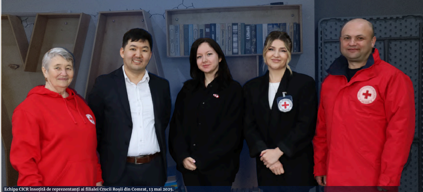
Echipa CICR însoțită de reprezentanți ai filialei Crucii Roșii din Comrat, 13 mai 2025.