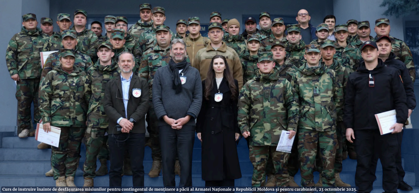
Curs de instruire înainte de desfășurarea misiunilor pentru contingentul de menținere a păcii al Armatei Naționale a Republicii Moldova și pentru carabinieri, 23 octombrie 2025.