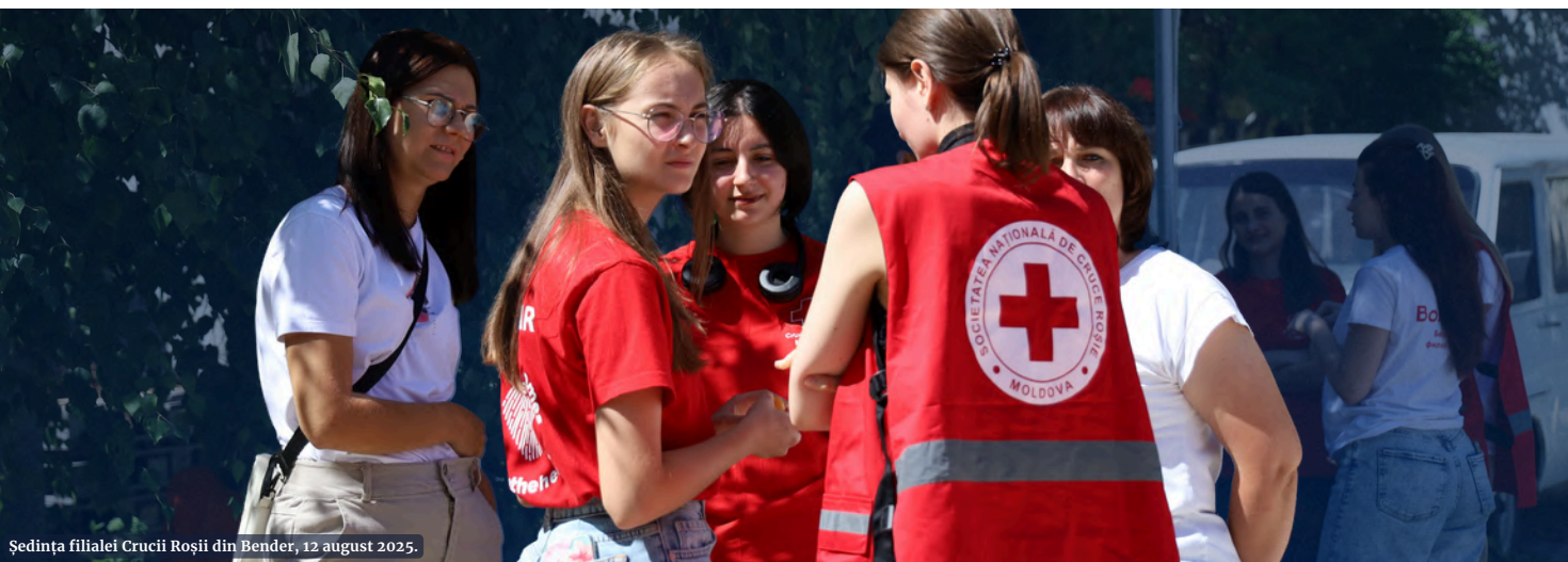
Ședința filialei Crucii Roșii din Bender, 12 august 2025.

CICR și-a menținut sprijinul tehnic și financiar acordat SCRM pentru consolidarea serviciilor de căutare și reunificare a familiilor. De asemenea, împreună cu filialele SCRM din Bender, Grigoriopol și Rîbnița, CICR a continuat să sprijine cele mai vulnerabile cazuri dintre refugiații ucraineni, pentru a le acoperi nevoile esențiale și urgente.