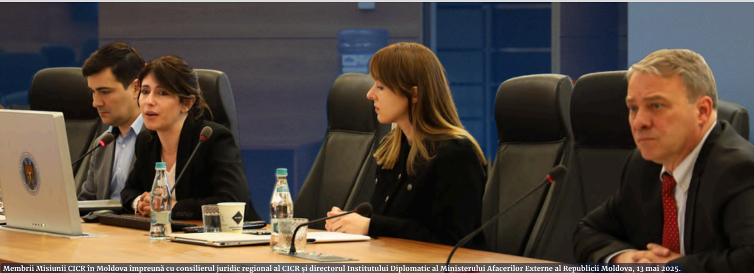
Membrii Misiunii CICR în Moldova împreună cu consilierul juridic regional al CICR și directorul Institutului Diplomatic al Ministerului Afacerilor Externe al Republicii Moldova, 13 mai 2025.