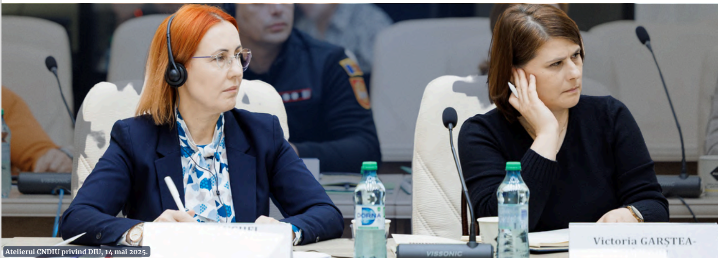
Atelierul CNDIU privind DIU, 14 mai 2025.

Pornind de la acest atelier, CICR a facilitat, de asemenea, participarea a doi reprezentanți ai CNDIU la cea de-a doua Conferință Regională a Comitetelor Europene de DIU, desfășurată la Varșovia în perioada 20–21 mai. Conferința a continuat discuțiile în cadrul Inițiativei Globale privind DIU, care își propune să plaseze DIU pe un loc prioritar pe agenda politică la nivel național, regional și global.