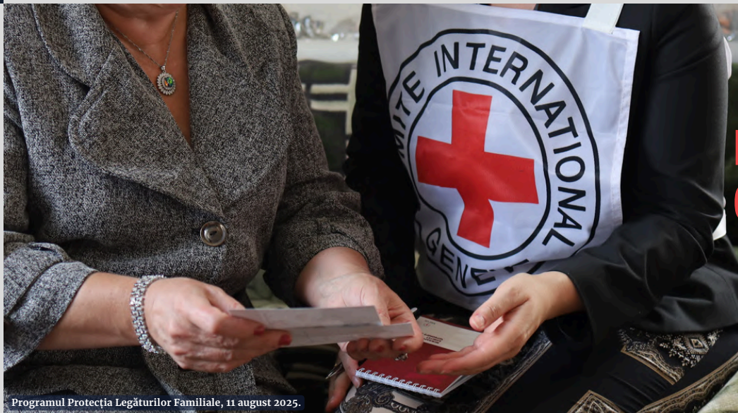
Programul Protecția Legăturilor Familiale, 11 august 2025.