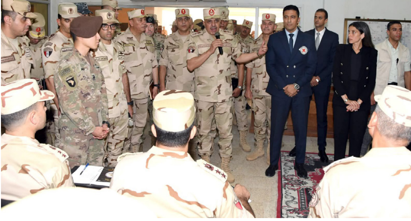
جزء من مشاركة اللجنة الدولية للصليب الأحمر في التدريب العسكري متعدد الجنسيات «النجم الساطع» 2025

تعمل اللجنة الدولية على مستوى العالم على نشر الوعي بالقانون الدولي الإنساني من أجل حماية الأشخاص المتضررين من النزاعات المسلحة وحالات العنف. وتعمل بعثتها، في مصر، على التوعية بالقانون الدولي الإنساني على الصعيدين الوطني والإقليمي من خلال التواصل مع القوات المسلحة وقوات الأمن والقضاة ووسائل الإعلام والأكاديميين وأهم المؤسسات المعنية، مثل جامعة الدول العربية والأزهر.