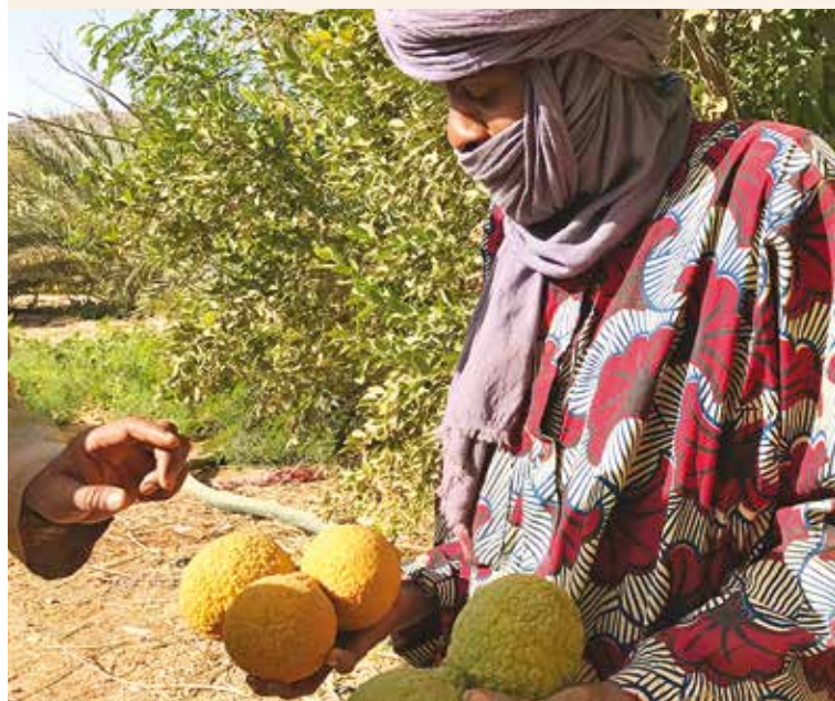
Appui aux projets maraichers à Kidal

ont bénéficié d'une aide financière pour l'appui à l'amélioration des revenus dans certaines localités de Tombouctou, Mopti, Gao et Kidal.