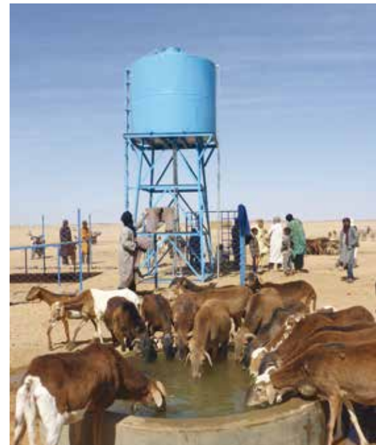
Réalisation d'un système d'eau à Tidjawen/Tessalit