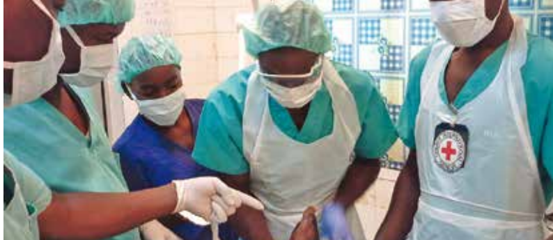
Prise en charge d'une victime de mine à l'Hopital de Gao

Personnes sensibilisées sur la problématique des violences et leurs conséquences ; 63 victimes de violences sexuelles et 412 victimes d'autres violences prises en charge, plus de 1 694 sessions de