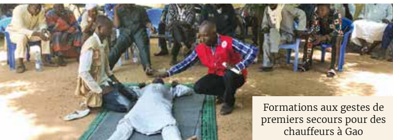
Formations aux gestes de premiers secours pour des chauffeurs à Gao

Formé 24 agents du service de Gynéco-obstétrique aux soins néonataux d'urgence (SONU) et 25 autres au cours de traumatologie en salle d'urgence (ERTC).