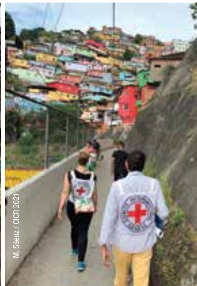
M. Sáenz / CICR 2021