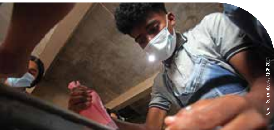
A. van SchermbEEK / CICR 2021

Para 2022, el CICR consolidará su capacidad de respuesta a las personas afectadas por la violencia armada, con base en sus necesidades, a través de la ampliación de asistencia a los grupos más vulnerables, fortaleciendo su resiliencia, ayudándolos a mitigar sus necesidades durante emergencias y apoyando a quienes necesiten recuperar sus medios de vida.