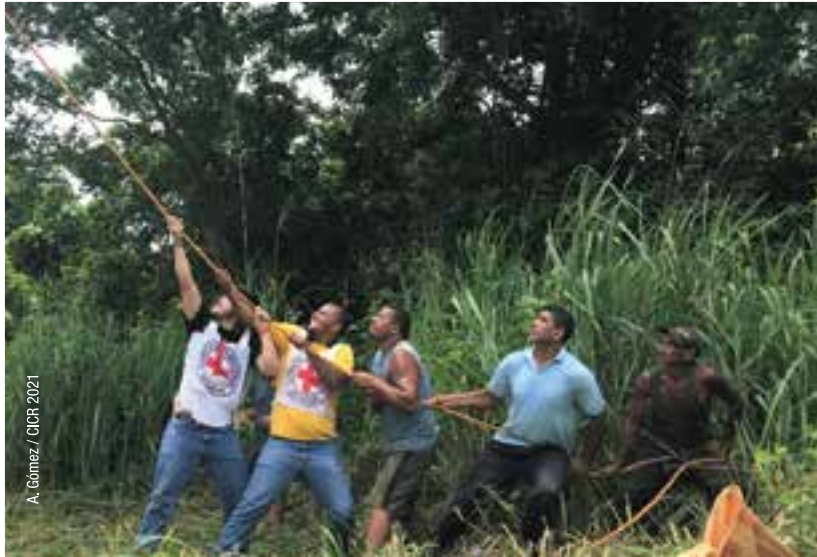
A. Gómez / CICR 2021