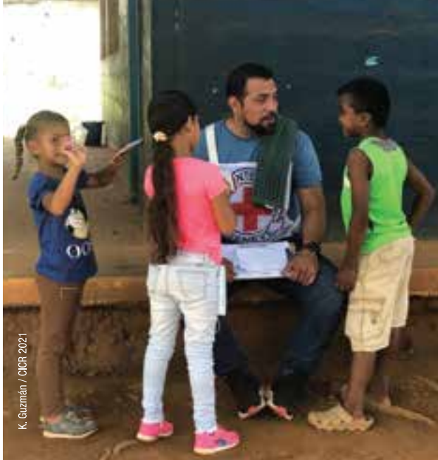
K. Guzmán / CICR 2021