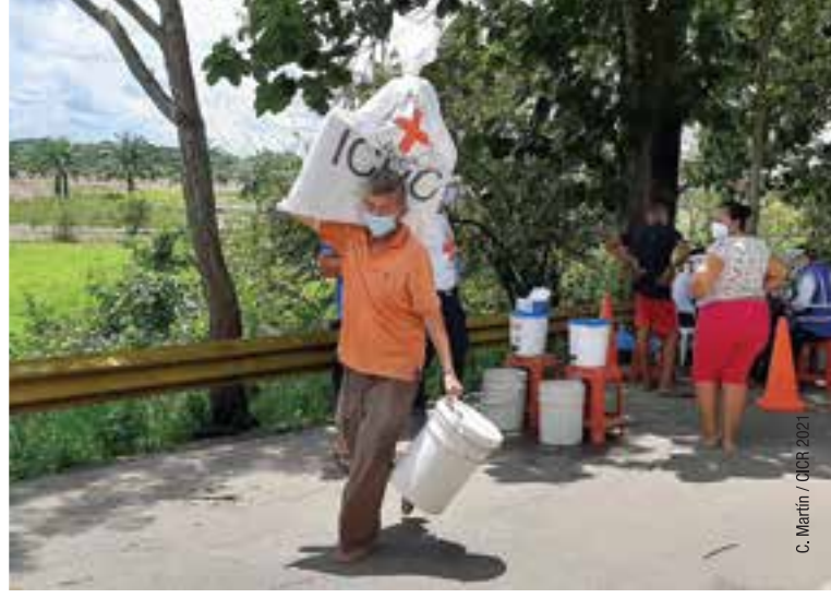
C. Martín / CICR 2021