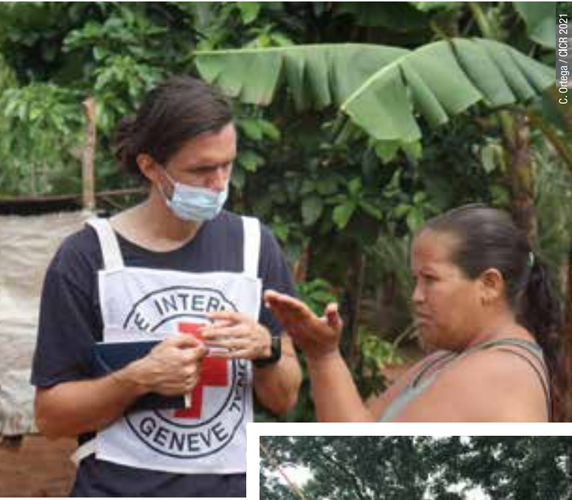
C. Ortega / CICR 2021