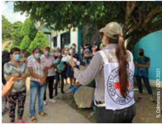
R. Colmenares / CICR 2021