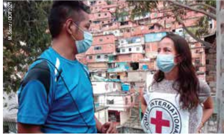
M. Sáenz / CICR 2021